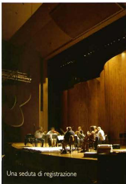
Una seduta di registrazione

La gamma dinamica permette anche una maggiore definizione del soundstage grazie all'incremento della risoluzione del dettaglio. Se si permette che gli strumenti acustici siano riprodotti con i loro giusti colori, essi risultano più facilmente identificabili nel soundstage. Pensate al tamburo e al pizzicato del contrabbasso di un gruppo jazz: meno compressione nell'estremo inferiore significherà un pizzicato più articolato e tamburi meno rimbombanti. La compressione renderà le loro due sonorità più difficili da identificare, una maggiore gamma dinamica permetterà