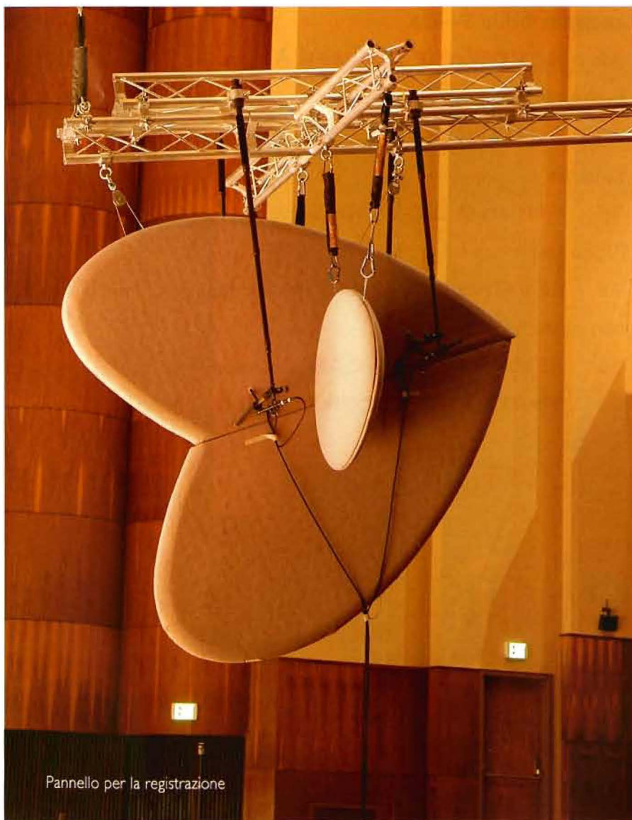
Pannello per la registrazione